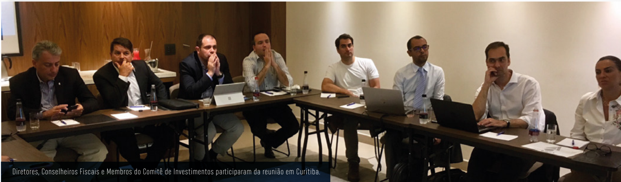
Diretores, Conselheiros Fiscais e Membros do Comitê de Investimentos participaram da reunião em Curitiba.