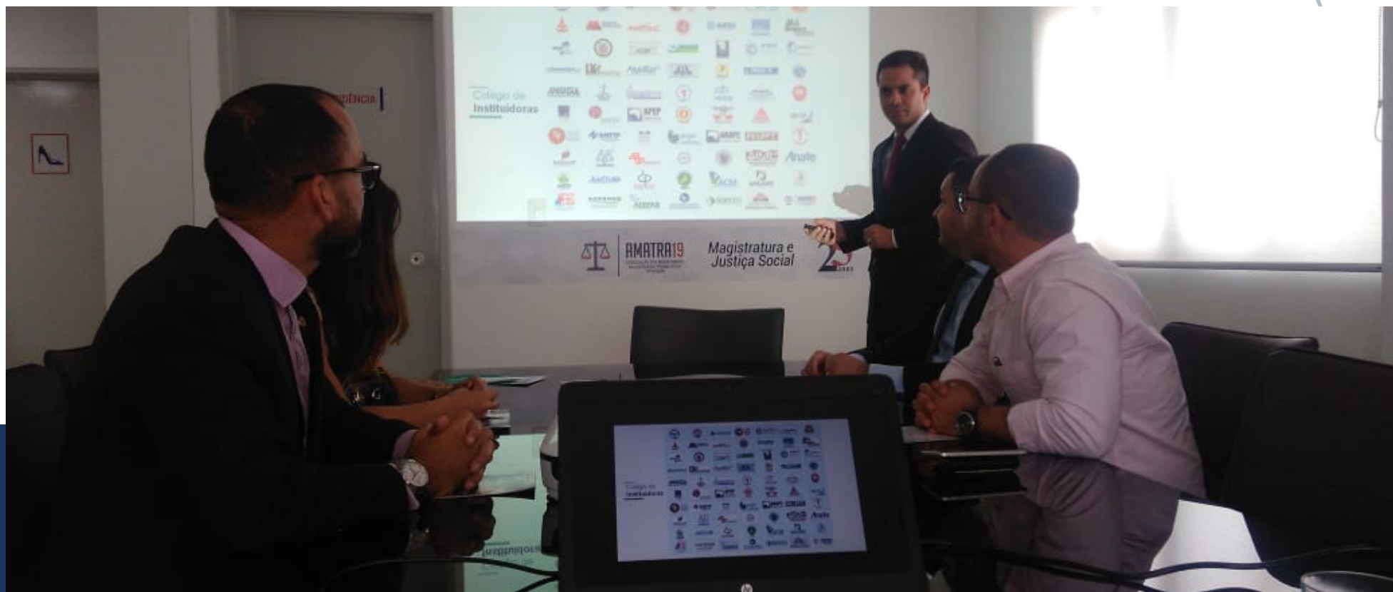
Palestra para integrantes da Diretoria da AMATRA19

Participaram do evento os integrantes da Diretoria da AMATRA19. Uma segunda apresentação aconteceu exclusivamente para associados da AMATRA19, no dia 16 de julho.