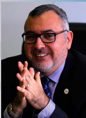
Joaquim Neto - presidente da ANADEP

“A Associação Nacional dos Defensores Públicos (ANADEP) participa da JUSPREV há quase cinco anos e, durante esse período, tem ressaltado às associações e aos Defensores Públicos de todo o Brasil a importância de se pensar e planejar o futuro através de uma instituição que nos pertence, oferece as melhores condições e permite acompanhar efetivamente a gestão com a máxima transparência”.