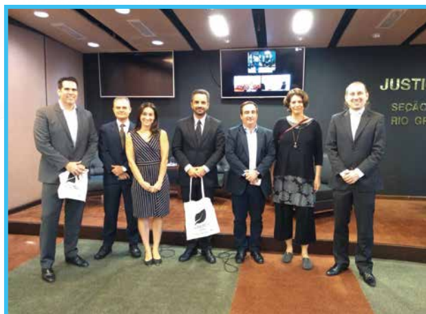
Palestra realizada na AJUFERGS, no Rio Grande do Sul.