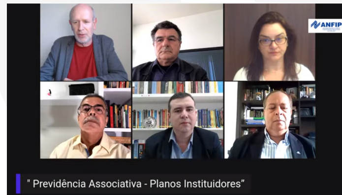
Live Série ANFIP - "Previdência Associativa - Planos Instituidores"

Deborah destacou ainda as principais diferenças entre as entidades abertas e fechadas. “Na entidade fechada, você é participante. Os órgãos dirigentes são formados pelos próprios participantes”. Segundo ela, outro diferencial são as taxas. Nas entidades abertas, que visam lucro, elas são altas e existem muitas cobranças, como